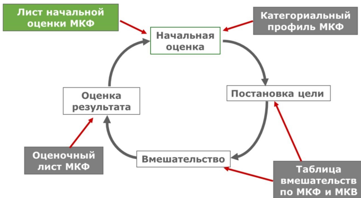
Рисунок 2 - Реабилитационный цикл.

Как правило, реабилитационные процессы являются длительными по времени и нуждаются в структуризации. Реабилитацию можно представить в виде циклически повторяющихся действий (рис. 2) [по 11].