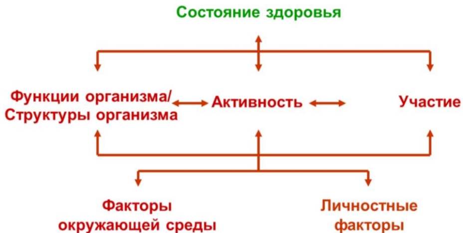
Рисунок 1 – Биопсихосоциальная концепция здоровья

Основанная на биопсихосоциальной концепции здоровья (рис.1) МКФ дает однозначные для понимания определения и упрощает использование методик, техник, шкал и т.п., связанных с МКФ, на практике.